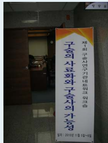
일본 교토 도지사대학으로 연구년을 떠난 김귀옥(사진 맨 오른쪽) 전 연구이사와 올해 11월 5-6일 열린 <제1회 구술사 연구기관 네트워크 워크숍> 당시 함한희 구술사학회 회장(사진 가운데)과 워크숍 현장