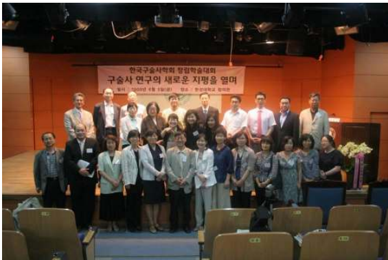
2009년 6월 4일 창립 학술대회