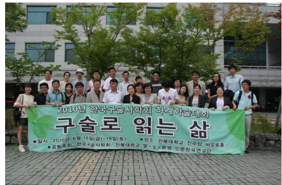
2010년 6월 18일 하계 학술대회