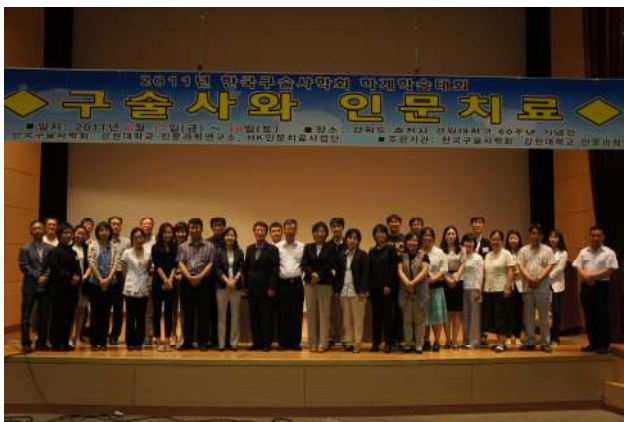
2011년 한국구술사학회 하계학술대회 단체 사진